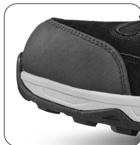
zesílená přední část proti okopu vonkajšia ochrana špičky reinforced rubber overcap nosek z gumovým wzmocnieniem