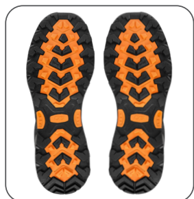
podešev podošva outsole podeszwa