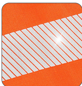
segmentované reflexní pásky segmentované reflexné pásky segmented reflective tapes segmentowe taśmy odblaskowe