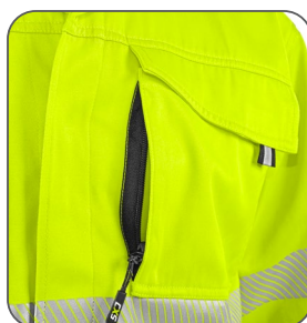
skrytá náprsní kapsa skryté náprsné vrecko hidden chest pocket ukryta kieszeń na piersi