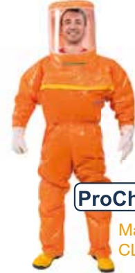
ProChem ® III