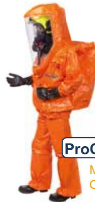
ProChem ® IV