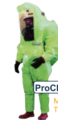
ProChem ® VI