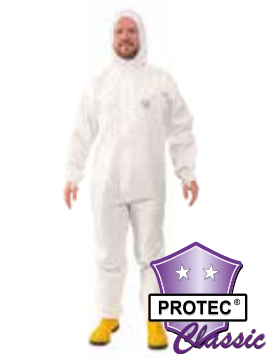
PROTEC ® Classic