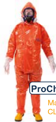
ProChem ® I