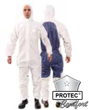
PROTEC ® Comfort