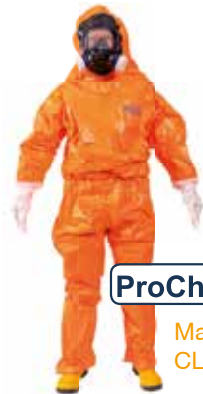
ProChem ® II