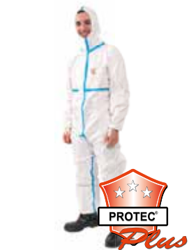
PROTEC ® Plus