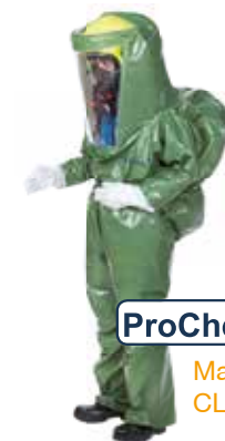
ProChem ® V