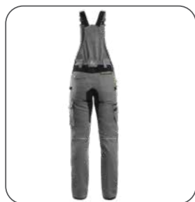
zadní strana zadná strana back side z tyłu