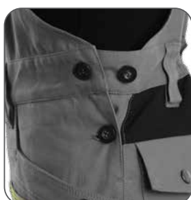
boční zapínání na knoflíky bočné zapínanie na gombíky side button fastening boczne zapięcie na guziki