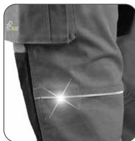
reflexní doplňky reflexné doplnky reflective accessories elementy odblaskowe