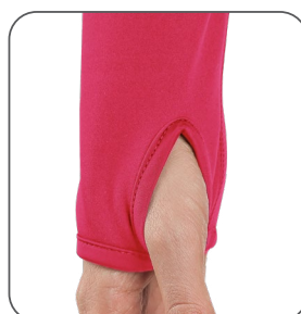
otvor na palec na rukávu otvor na palec na rukáve thumb hole on the sleeve otwór na kciuk na rękawie