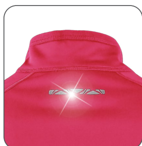
reflexní doplňky reflexné doplnky reflective accessories elementy odblaskowe