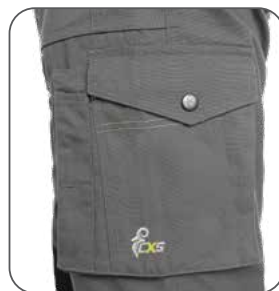
multifunkční kapsy na boku multifunkčné vrecká na boku multifunctional side pockets boczne kieszenie wielofunkcyjne