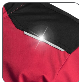
reflexní doplňky reflexné doplnky reflective accessories elementy odbłaskowe