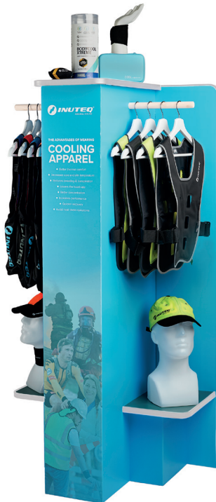
REGAŁ PROMO- CYJNY